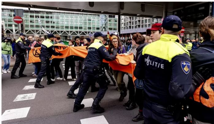
▲ Klimaatactivisten van actiegroep Extinction Rebellion blokkeren het kruispunt tussen de tijdelijke Tweede Kamer en het ministerie van Economische Zaken en Klimaat. Met een week vol acties demonstreert de actiegroep tegen het huidige klimaatbeleid van de overheid.